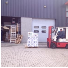
Inhuizen van de CSS collectie